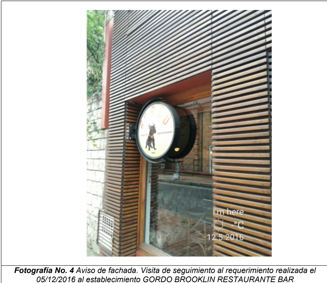
Fotografía No. 4 Aviso de fachada. Visita de seguimiento al requerimiento realizada el 05/12/2016 al establecimiento GORDO BROOKLIN RESTAURANTE BAR

ALCALDÍA MAYOR DE BOGOTÁ D.C. SECRETARÍA DE AMBIENTE